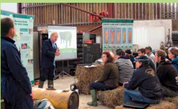
Reino Unido: Los jóvenes socios de Young Farmers' Club aprenden los rudimentos de la comercialización de la carne.

» Con un proyecto bien pensado es más fácil comenzar.« Stéphane Honorat