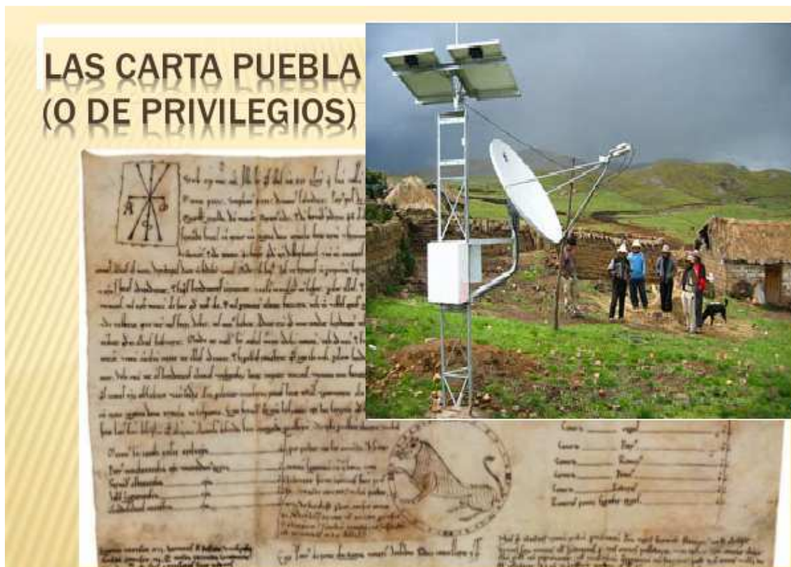
"Carta Puebla siglo XXI"

La apuesta por las tecnologías de la comunicación y la información aplicadas a la realidad rural no puede ser otra oportunidad perdida para estos territorios.