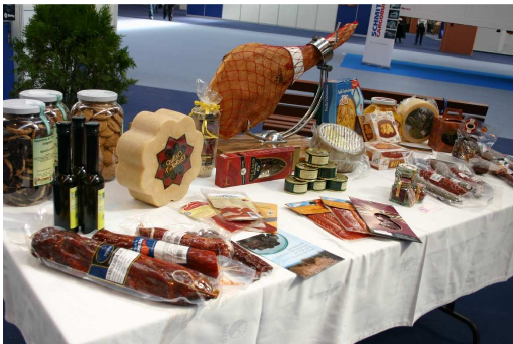
“Alimentos de calidad Teruel”

La producción de alimentos se está desplazando hacia países emergentes y hacia producciones industrializadas, por lo que en términos de producción cuantitativa los terrenos que por razones geográficas ofrecen bajas ratios cuantitativas de producción solo tienen posibilidad de ser dedicados a producciones de calidad, cuyo mercado es muy limitado, o a producciones con efectos colaterales no deseados, como las contaminaciones que produce el sector porcino. En todo caso la mano de obra necesaria es cada vez menor.